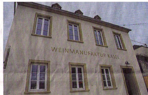
„Weinzeit“ erwartet im Haus der Weinmanufaktur Kasel – im Herzen der Weinbaugemeinde.

Weinzeit will diese Tradition des Weinbaus wieder mehr ins Bewusstsein rücken – und das im Herzen des Ruwertal-Gemeinde, deren Ortskern das zusätzlich belebt.